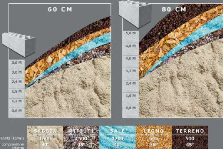
DIMENSIONI DEL CAMPIONE (CARICO DI COMPRESIONE UNILATERALE)

I blocchi "AggrEco® Block" vengono realizzati con cemento portland CEM I 4.25 e aggregati riciclati da manufatti in calcestruzzo. La classe di resistenza dei blocchi è C20/25, questa sigla precisa appunto la resistenza del materiale a compressione, infatti questo tipo di calcestruzzo ha una resistenza di 250 daN/cm 2 con peso specifico "2,1 ton./mc."